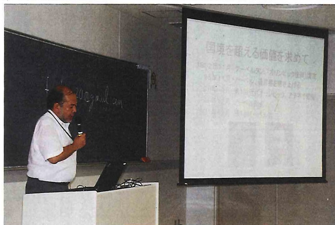
▲ 「科学とメディア」で講義する上田俊英 朝日新聞社編集委員

「国際ジャーナリズム論」は、特派員経験者が毎週交代で講義に来て、最新の世界の現状やその報道を話している。作家の集まりの日本ペンクラブと提携した「言葉とメディア」の講師は、作家や映画監督たちだ。沖縄タイムス社と提携した「沖縄ジャーナリズム論」は、毎夏、沖縄で集中講義をする。普天間や辺野古を視察するほか、米海兵隊幹部や大田昌秀元知事に直接話を聞き、沖縄の基地問題を、実感的に学んできた。いずれの協力講座も、学生たちにはたいへん好評だ。