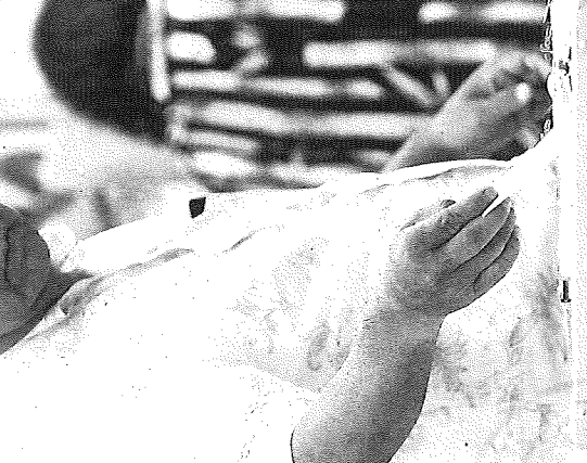
県知事選の期日前投票に上巻を採る有権者。県内紙は知事選報道でアクトチエックを実施し、紙面化した

辺野古新基地建設を巡り、12月は大きなヤマを迎えている。政府はパフォーマンスとしての「土砂投入」を宣言し、海は埋め立てられ不可逆な状況まで進んでいると既成事実化を図ろうとしている。本土メディアは間違いなく大拳を押し寄せ、その様子を大々的に報じ、結果として沖縄に諦めを強める空気を醸成する役割を担うことになるだろう。会長雄策前知事の遺志である承認の撤回は、国が私人に成りませず選挙ど