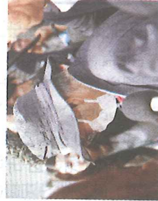
呼称をどう報じるか

事件報道などでの職 業(肩書)呼称をど うすべきか。公人、 私人の別など「権威」 との関係から課題を 指摘する。