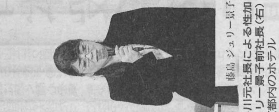
藤島ジュリー景子 ジャニーズ事務所の社長による性加害問題で、記者会見する藤島ジュリー景子前社長(右)と東山紀之社長(9月7日、東京市内のホテル)

っている沖縄社会を生きる 同胞に対し「痘世児」「売 養婦」という罵詈雑言で差 別的な眼差しによる解説 (平良氏がつけたものでは ない)があり、それは平 良氏の責任である